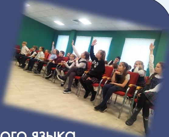
Урок английского языка «История Англии»