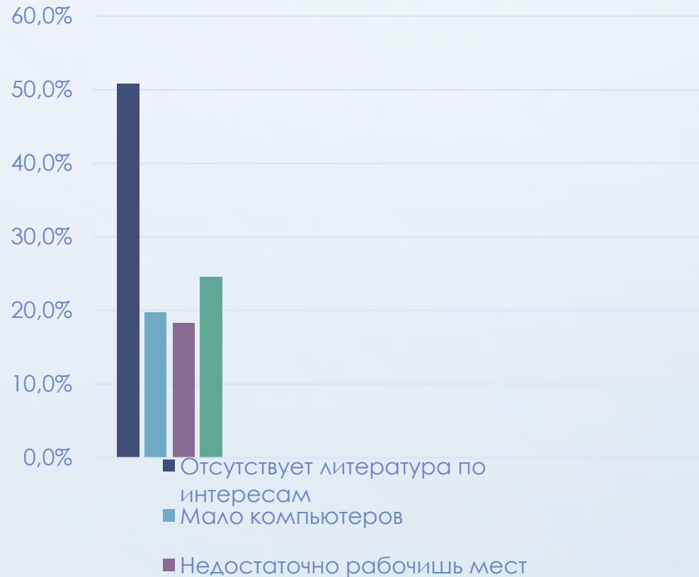
Что не устраивает в работе библиотеки